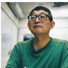
朝倉景樹 Kageki Asakura (日本)

黃英琦太平紳士身兼數職，在香港文化、社創、教育，到法律、政界都會出現的名字，但不論在什麼界別，她重視的，是推動創意、創新和文化發展。從成立香港當代文化中心、香港兆基創意書院、創不同(MaD, Make a Difference)、好單位(Good Lab)，到教育燃新(Ednovators)，Ada期望在不同的領域創造環境和機會，幫助年輕人實踐理想，為香港社會面對的問題提供創新的解決方案。她認為社會的發展趨勢定必是多元，是社會和跨界創新，是共享和協作經濟，因為「追求共贏」和共創未來，才能讓更多人受惠。