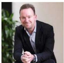
Geoff Mulgan (英國)

知名永續與仿生系統設計與創新家，英國皇家文藝學會 (Royal Society of Arts) 與國際未來論壇 (International Futures Forum) 成員，伊比利亞仿生科技 (Biomimicry Iberia) 共同創辦人，曾任教於聯合國訓練研究所 (UNITAR) 共同推動的「蓋婭教育 (Gaia Education)」計畫。其著作《設計重生文化 (Designing Regenerative Cultures)》是未來學與永續社會發展的經典之一，被聯合國氣候變遷委員會時任主席Christina Figuerers譽為生態危機最重要的論述之一。