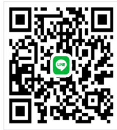
110-新住民語文競賽群組